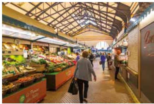
Le Parlement / La Criée, le Marché Central