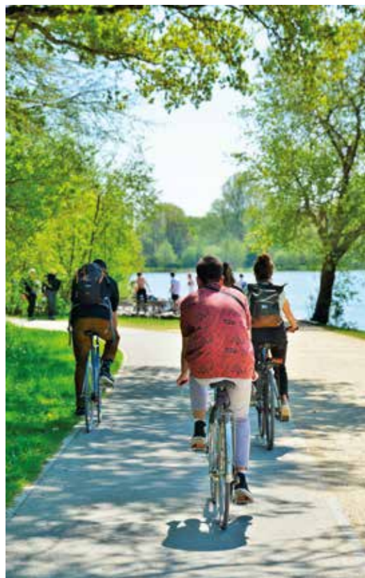
Piste cyclable le long de la Vilaine