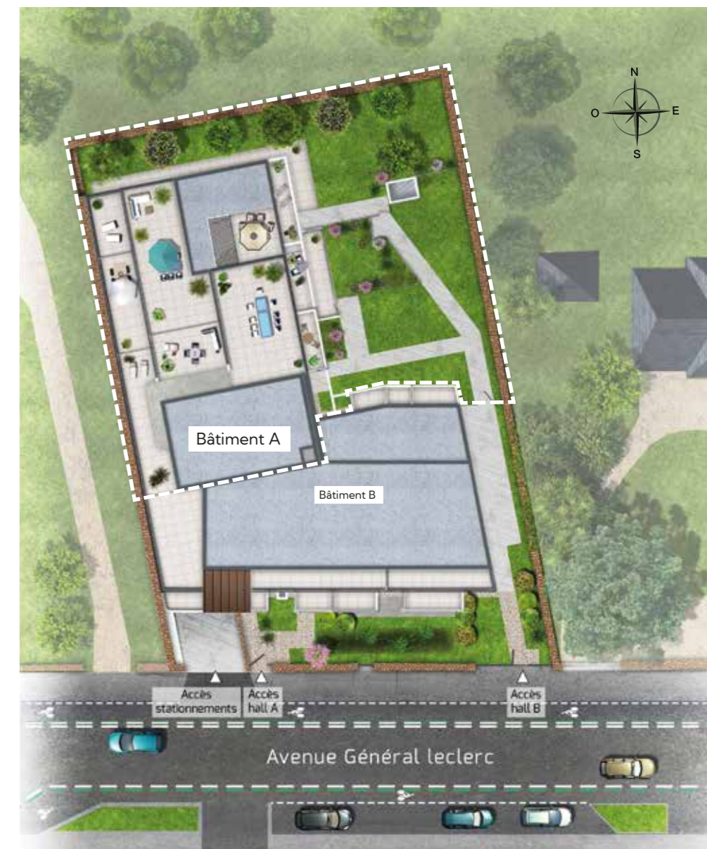
Plan de masse de la résidence