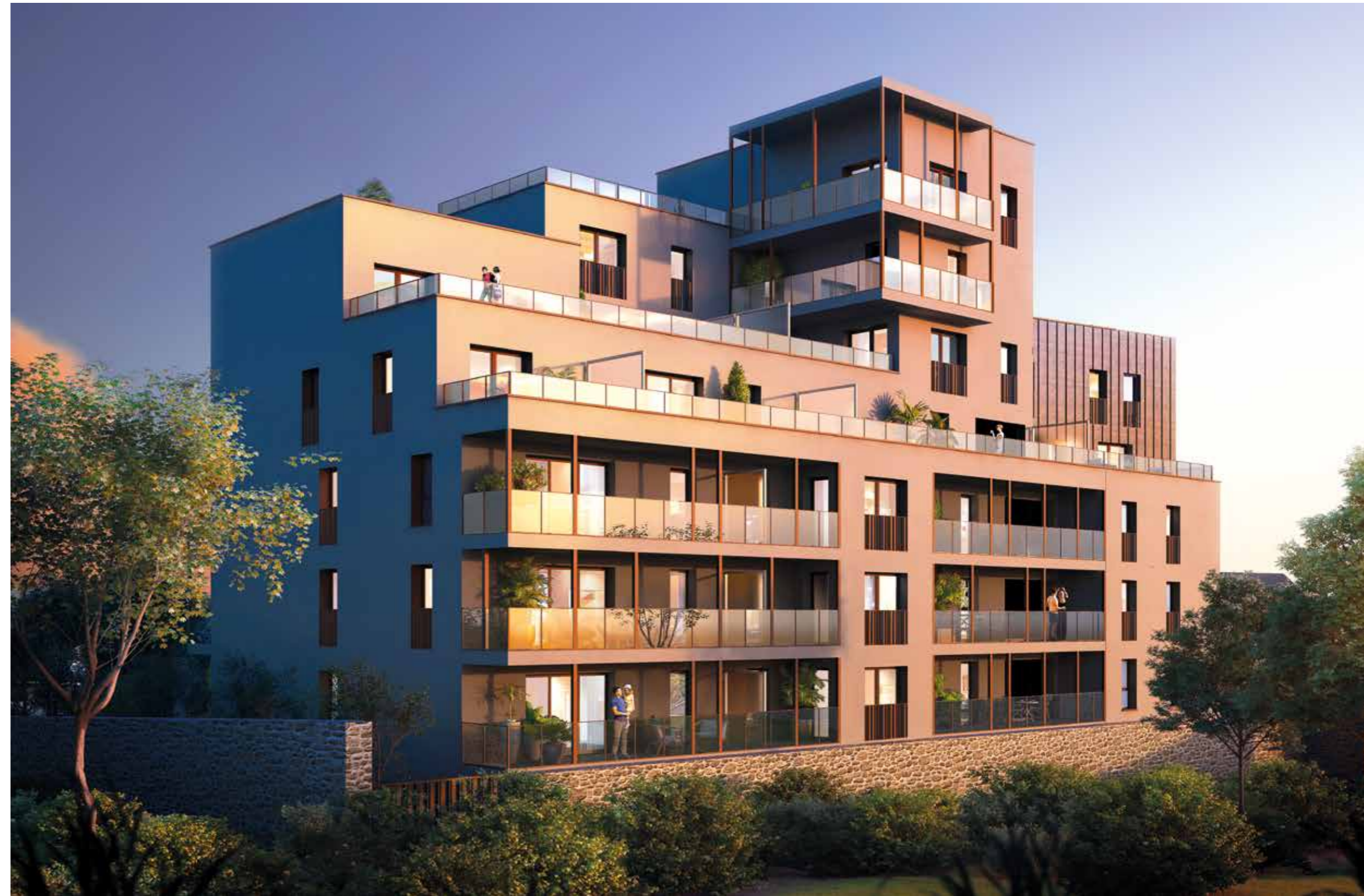
Vue côté ouest