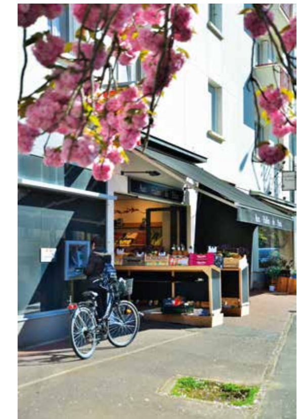
Commerces rue de Paris

Située entre le quartier Jeanne d'Arc et Beaulieu, la résidence ALBA bénéficie des atouts de ces deux pôles d'attractivité. D'un côté, la vie associative extrêmement riche et variée de Jeanne d'Arc répond aux aspirations de ce quartier très familial. De l'autre, le Campus de Beaulieu, très vert et aéré, offre le cadre idéal pour les études et les activités sportives.