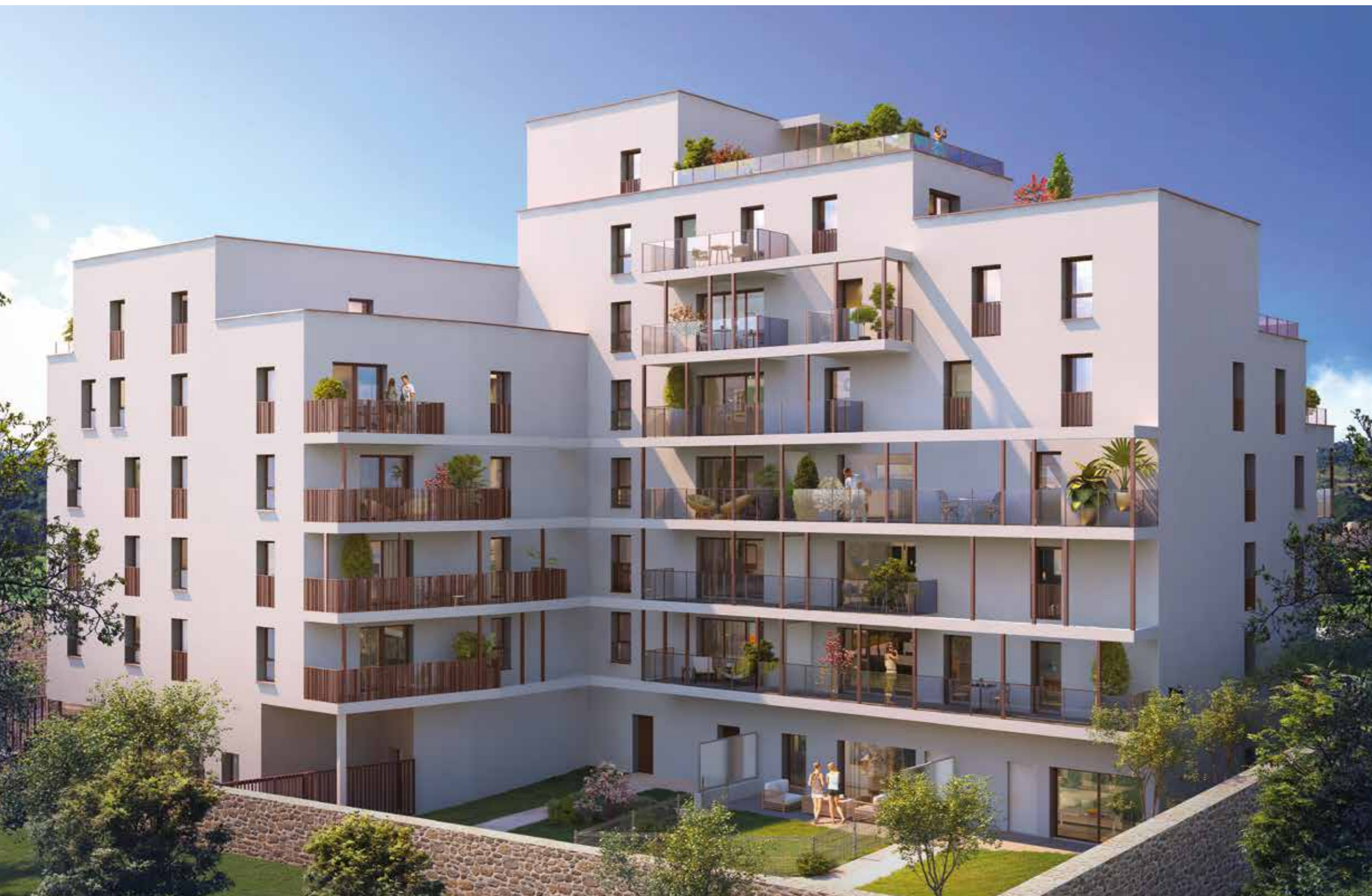
Vue depuis le cœur d'îlot