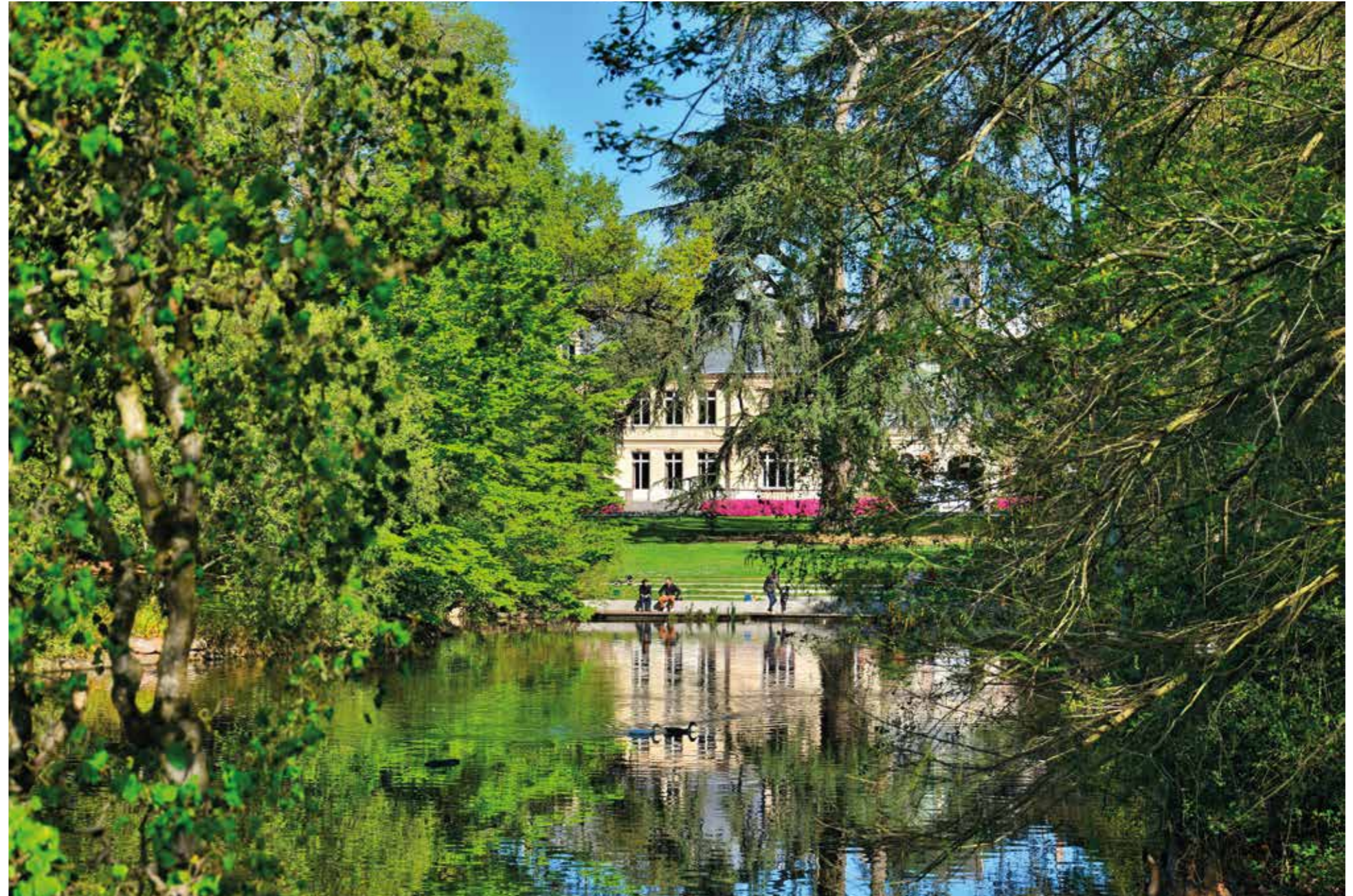
Parc Hamelin Oberthür