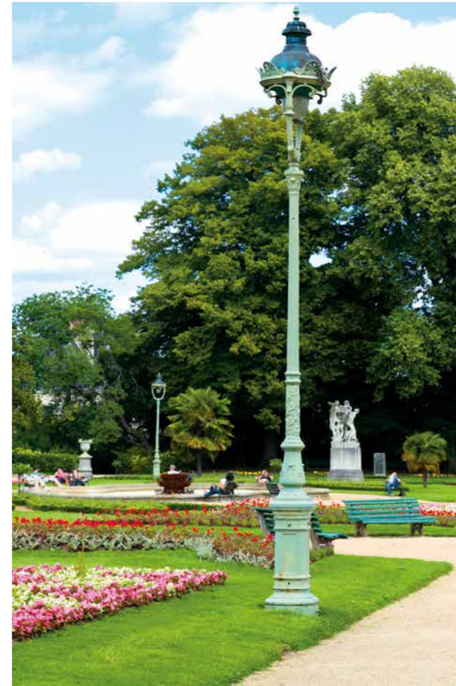
Parc du Thabor

L'art de vivre rennais se déploie bien au-delà de son centre historique avec ses petits commerces, ses terrasses et restaurants. Cette douceur de vivre et cette convivialité irriguent également les événements et lieux culturels (théâtre, concert, spectacle, festival) qui feront vibrer votre quotidien.